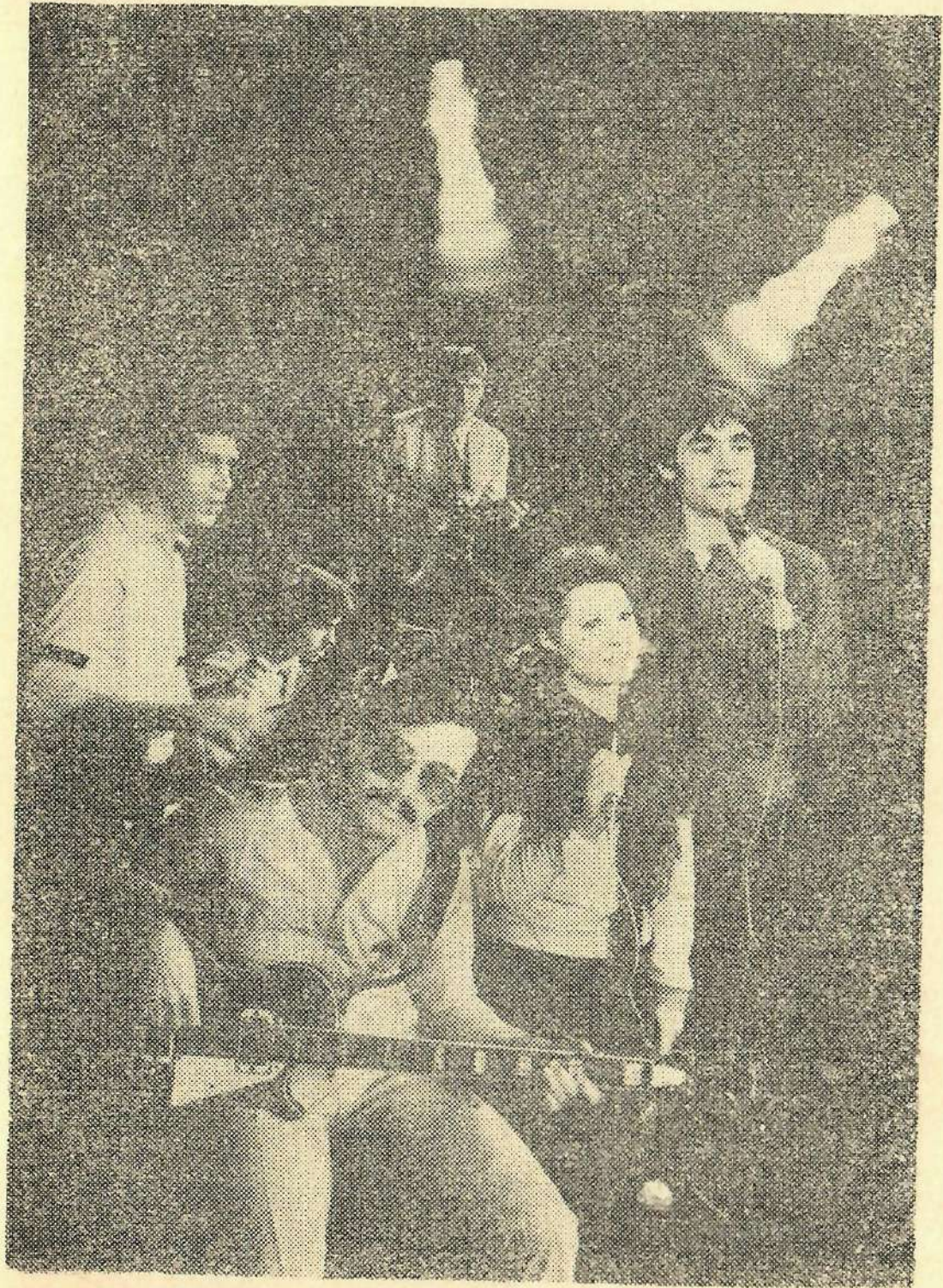
Репетиция новой программы ПФ 40379.2668—300. Тип. КамАЗа, 1986 г.