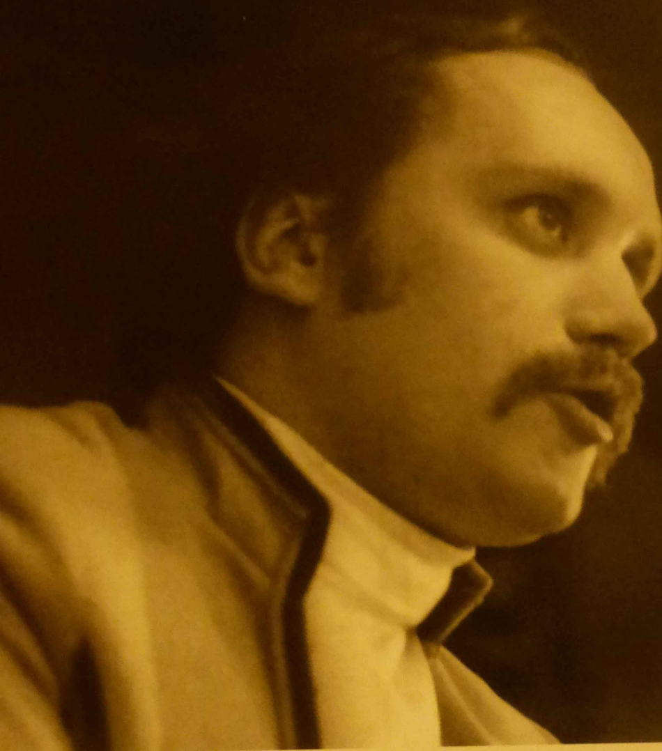
Кадр из телефильма «Песняры». 1971 г.