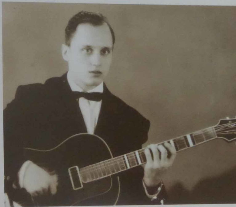
Калининград. 1960 г.

Никогда не забуду наш первый с отцом отпуск tet-a-tet в Свердловске и Магнитогорске. Показывал он мне во время этой поездки место, где Чапай переплывал бурный Урал. Кстати, отец рассказывал, как сам его пытался переплыть. В те времена говорили, что он плывал, как рыба, но мне кажется, что потом он уже никогда не был таким вот «ихтиандром». Во всяком случае, когда бывала у них на даче в Лапоровичах, что на Минском море, мне ни разу не приходилось видеть его в «большом заплыве».