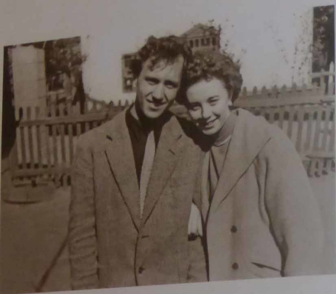
Актюбинск. Май 1958 г.

проверка, что все выложили на витрины. Купили все, что только можно. Зашли в другой – то же самое! Спокойно лежит дефицит, которого в Свердловске и не сыщешь. Когда заглянули в третий, то решили, что во всех магазинах сразу проверок быть не может...»