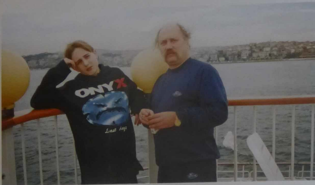
Фестиваль «Бархатный сезон». Пересечение Босфорского пролива. 1996 г.

записать мне группу «Queen». Любовь моя к «The Beatles», к Чайковскому привита им: он эту музыку часто слушал, а я, даже как бы и не подключаясь к процессу, все же подсознательно усваивал то, что звучало. Папа никогда не заставлял что-либо делать. У нас слово «насилие» даже не произносилось. Но в музыкальной школе я обязан был трудиться. Да, был момент, когда я не хотел там продолжать учебу, но отец настоял: «Ты сейчас потерпи, чтобы со временем не сожалеть, если откажешься». И он был прав: теперь я действительно не сожалею, что занимался музыкой (фортепиано) в свое время. А после уроков отец учил меня игре на гитаре. Он был замечательным мастером. Об этом мало кто знает, но отец был одним из самых лучших гитаристов в Союзе. У него, у одного из первых музыкантов в Беларуси, появилась электрогитара. Бывало, он все личные средства во время поездки за границу тратил на качественные инструменты, как, впрочем, и некоторые ребята из ансамбля «Песняры».