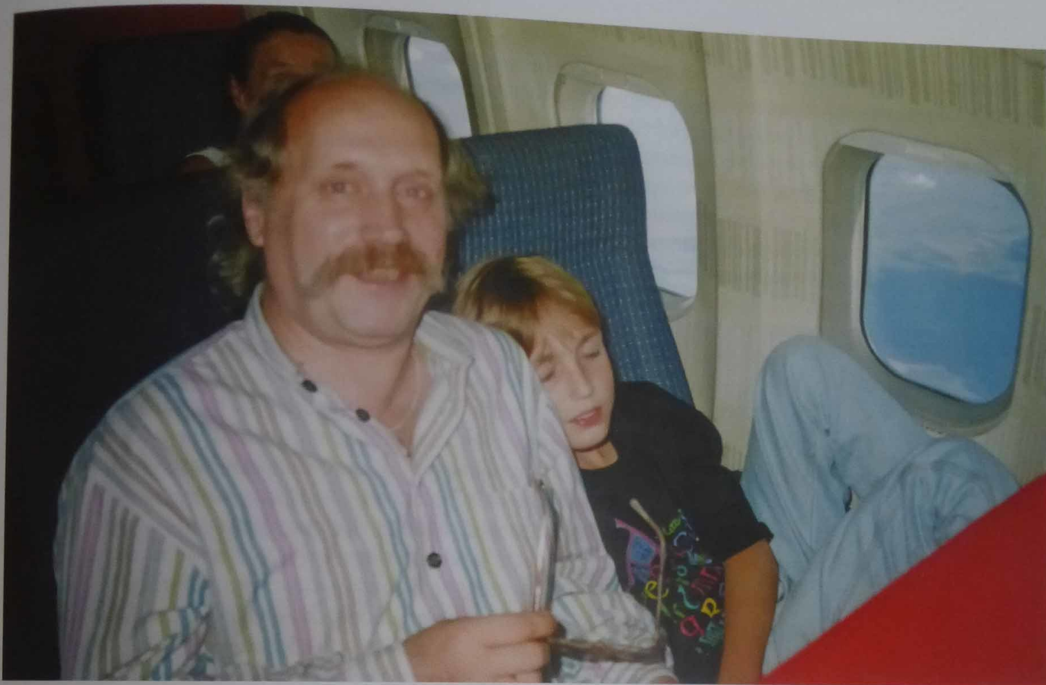
Первое путешествие через океан на фестиваль в Аризону. 1994 г.

владел, так как гонял когда-то по Свердловску на коньках. Мы с ним вечерами, если они у него были свободны, всегда катались по близлежащим улицам. Народ, конечно, оборачивался, но так как у нас люди воспитанные, то тактично делали вид, что тут не заслуженный кто-то катается, а просто отец с сыном. Безусловно, перепутать папу с кем-нибудь было невозможно, да и многие знали, где мы живем. Когда мы были в загранпоездках, обязательно покупали новые ролики и экипировку к ним. Так что катались мы с папой и в Италии, и во Франции. В Париже, помню, нарезали круги вокруг Эйфелевой башни.