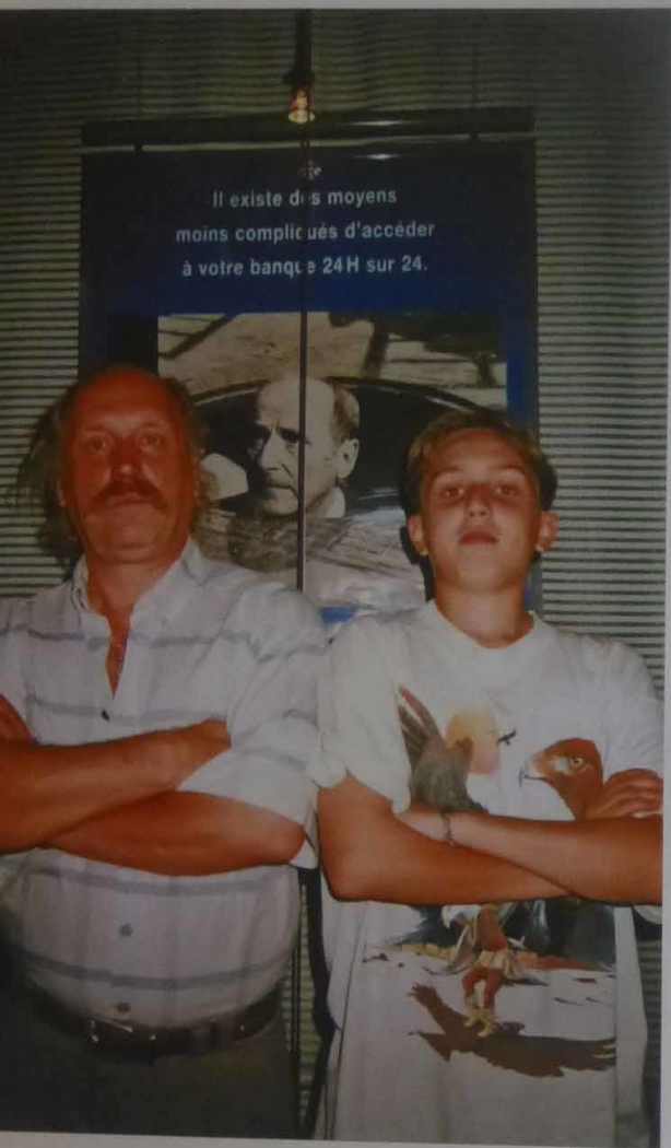
ая прогулка. Париж, Франция. 1997 г.

что он мог сделать обидчику,— не мстить, никогда на подлость подлостью не отвечать, чего не каждый мог понять. И в последние его месяцы, трагические, на больничной койке, когда отец терпел невероятную физическую боль (даже врачи удивлялись мужеству папы, потому что многие подобных мучений не выдерживали, ломались), он учил меня стойкости. В лечкомиссии в Минске он никогда не выезжал на прогулки без меня, всегда ждал. Это был единственный момент, когда мы могли поговорить, оставшись наедине. Даже лечащий врач отходил в сторону. А папа, когда я слишком уж быстро вел коляску по дворику, всегда тихо предупреждал: «Не гони...» Такого дворика в Москве уже не было.