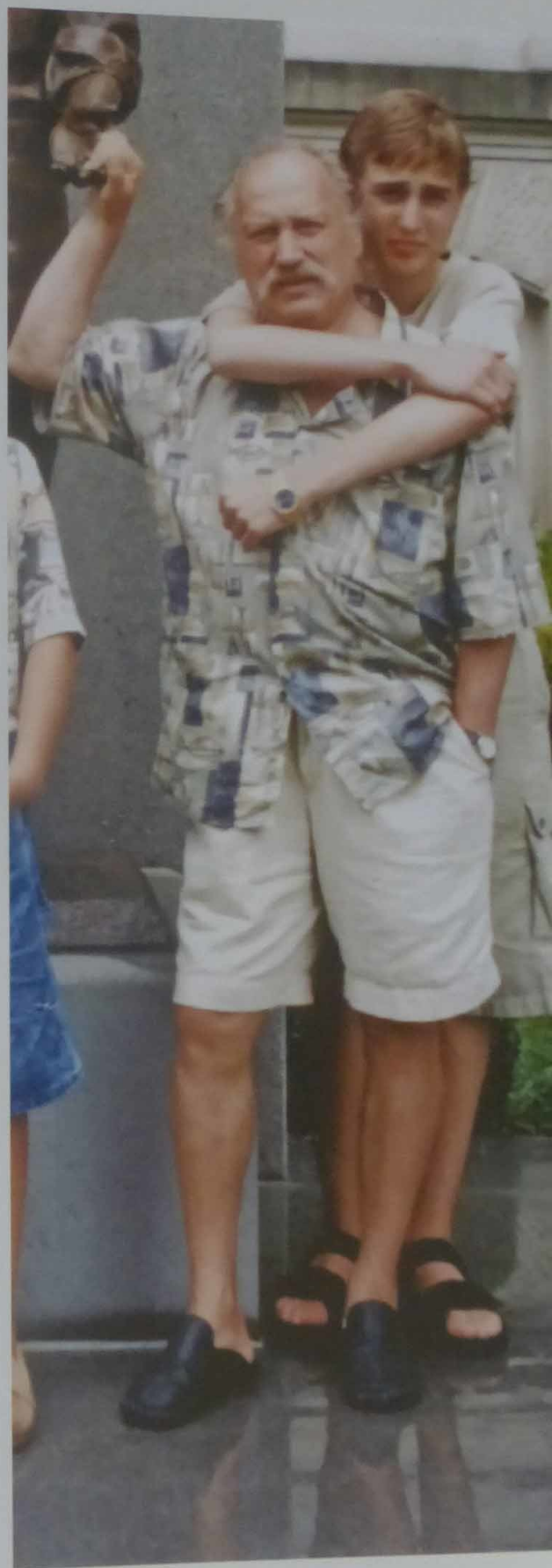
Атланта (США). 2001 г.