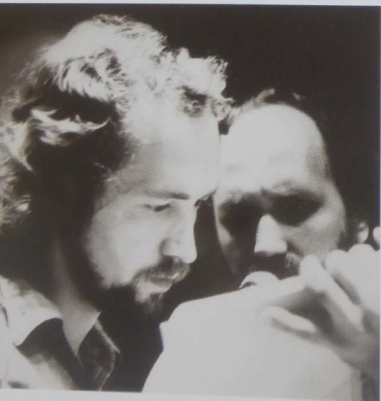
Режиссеры документального фильма «Диск».

головой о пол и сказал: «Ребята, спасибо. За такой короткий срок я на вас заработал миллион долларов!»