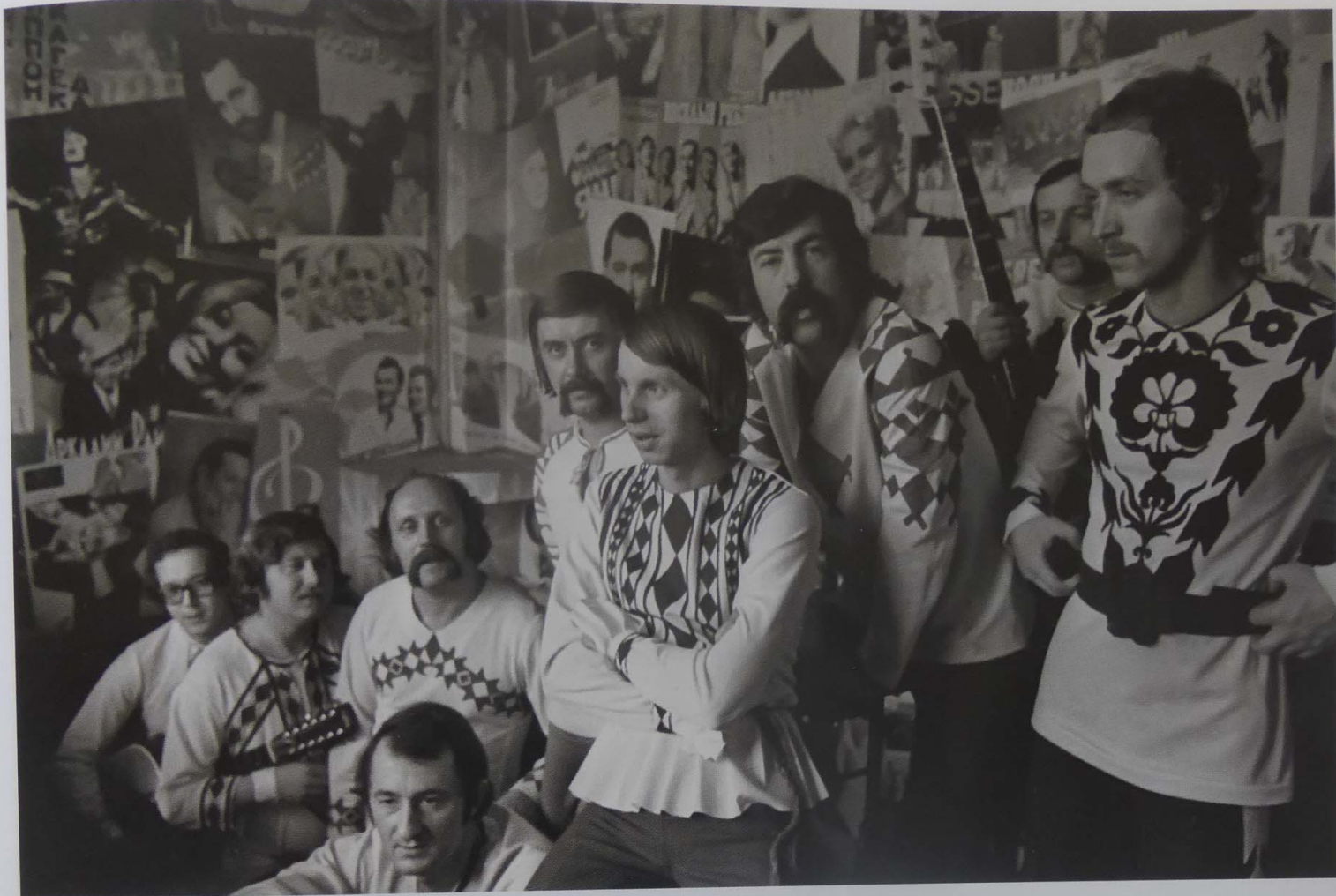
«Песняры» в Московском театре эстрады. 1976 г.