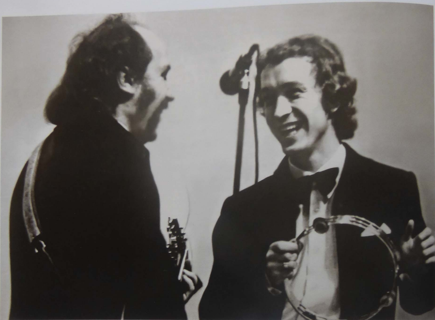
Чаму ж нам не пець? Начало 1970-х

Мулявин мне как-то сказал: «Леня, нам надо переходить на хозрасчет». В 1990-х ситуация складывалась таким образом, что мы не могли исполнять наши новые песни, потому что на всех государственных концертах от нас требовали только старые хиты. Честно сказать, «Аляксандрына» і «Касіў Ясь...» у меня уже просто в горле комом стояли. Зрители, наверное, думали, что у нас нет новых песен, если мы все время исполняем старые. Но все обстояло в точности до наоборот. И тогда Мулявин очень четко понял, что наше будущее в наших руках. И начал кардинально реформировать не только «песняровский» репертуар, но и состав ансамбля, ибо из первых двух составов ансамбля по разным причинам оставались единицы. Но это уже другая тема.