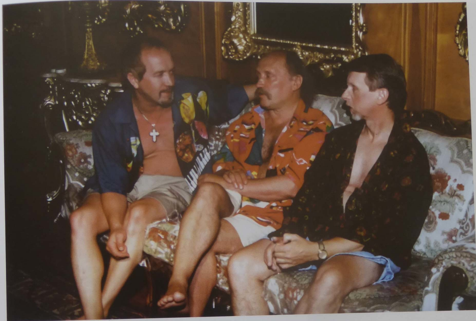
«Белорусский мотив...» на далеком континенте.