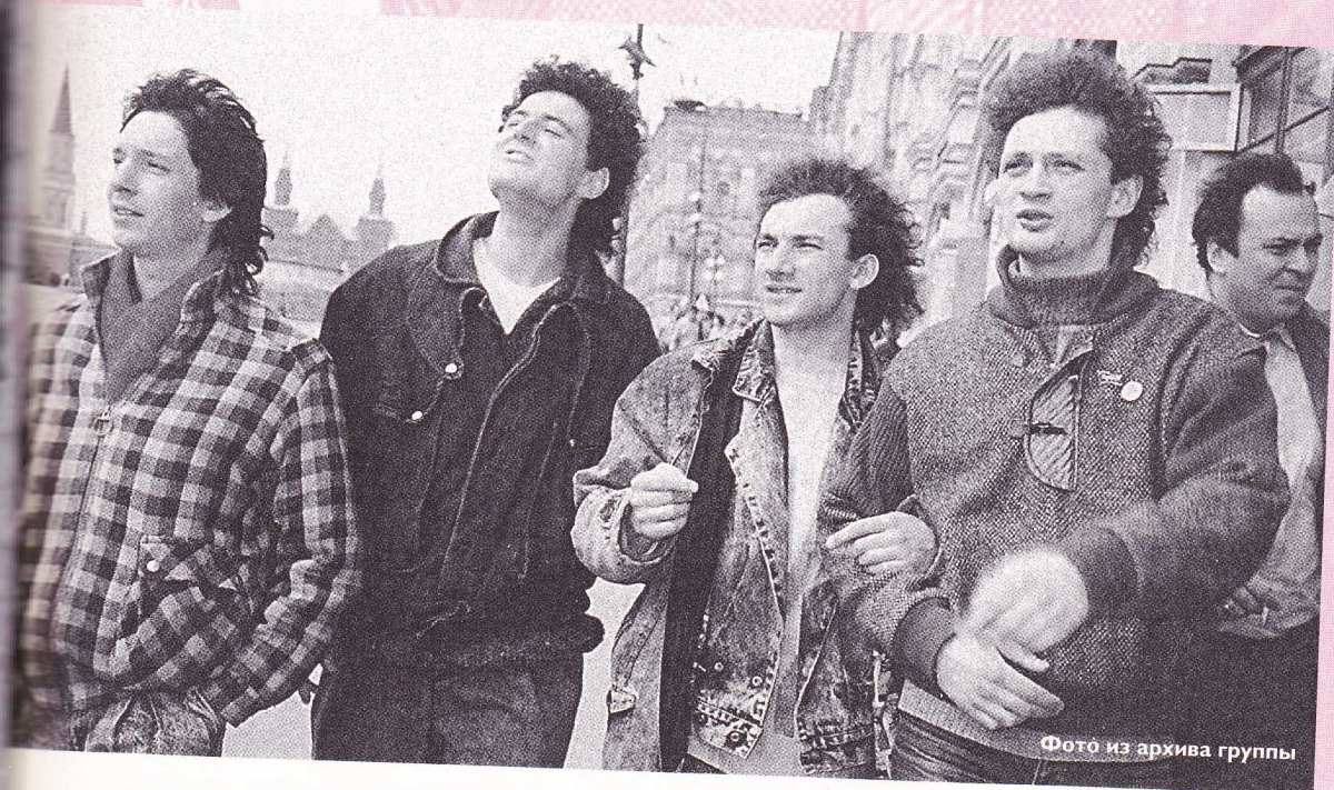
Фото из архива группы

«Вокально-инструментальный ансамбль» отмени сразу, написать «рок-группа» — заранее подписать себе смертный приговор: рок-группа в стране уже была, в Москве — «Машина Времени», больше не надо. И на этот раз выручили битлы. Одна их пластинка называлась «Beat-combo The Beatles», оттуда и позаимствовали. Смотрелось неплохо — бит-квартет «Секрет».