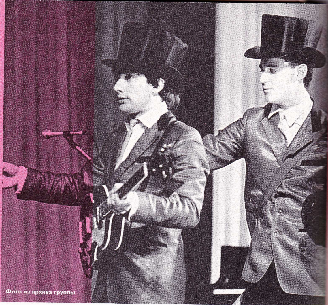
Фото из архива группы