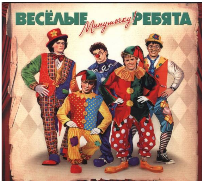
Бомба Мюзик, 2011 г.

ся лауреатом телевизионной «Песни года 1986».