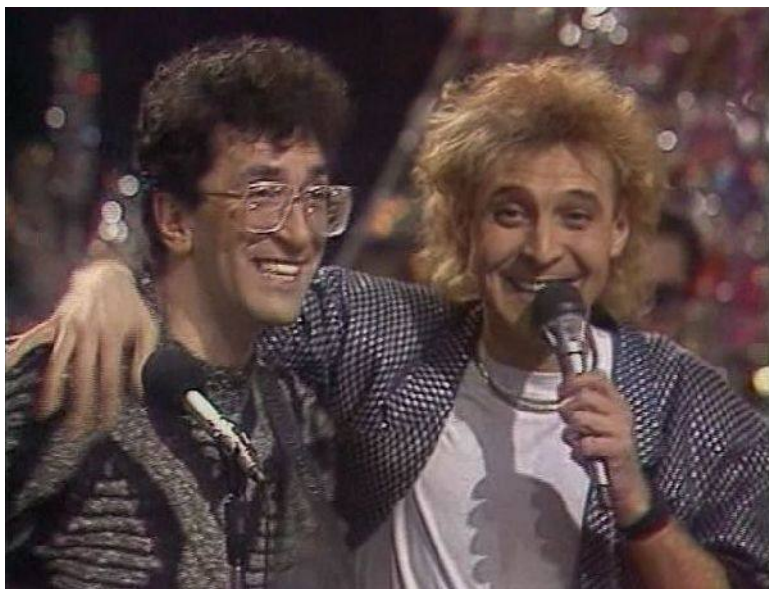
стоп-кадр телевизионной передачи «Песня года – 1988», 01.01.1989 г.

телезрителей ждет много сюрпризов. Записываем для новой пластинки песни: "Родня" Р. Паулса и И. Резника, "Про клоуна" В. Добрынина и С. Осиашвили...».