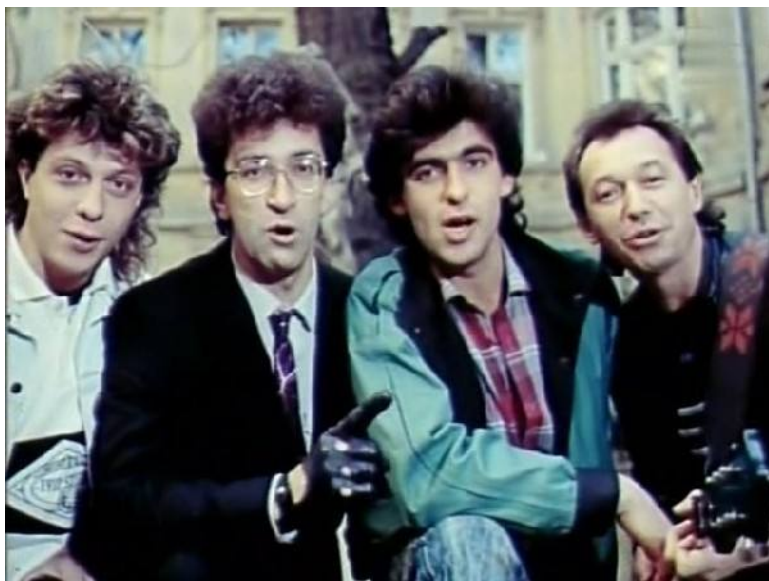
Стоп-кадр фильма «Приморский бульвар», Одесская киностудия, 1988

Примерно в это же время записывается песня «Осень моя» (В. Матецкий – В. Баркас) в составе: Глызин – Буйнов – Ерастов – Чайка.