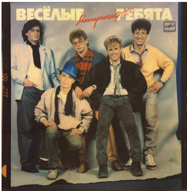
Всесоюзная Студия Грамзаписи, 1987