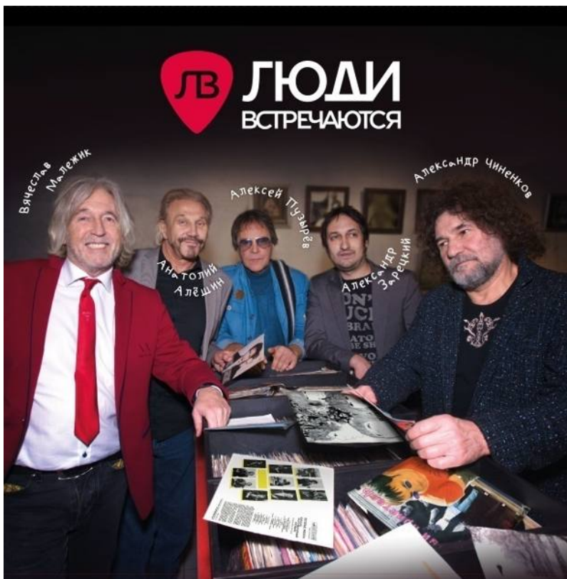
Мазай Коммуникейшенс, 2016 г.