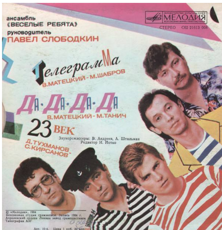
Всесоюзная Студия Грамзаписи «Мелодия», 1984 г.