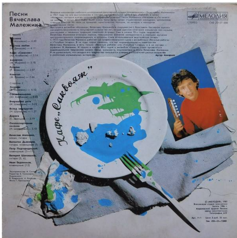
Лейбл: «Мелодия» (1987 г.) – С60 25127 000

Пластинка «МОНОЛОГ О ЛЮБВИ» Софии Ротару с показателем 588,1 тысяч на девятой строчке. Композиция «Песня нашего лета» записана с помощью ВИА «Весёлые ребята» .