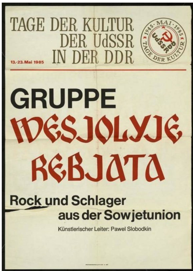
Фото афишы концертов в Германской Демократической Республике