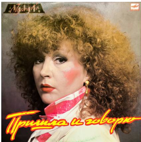
Label: «Мелодия» (1987г.) – С60 25059 009

мых виниловых дисках 1987 г. Отметим отдельно как и альбом самих «Весёлых ребят», так и альбомы бывших «весёлоребятовцев».