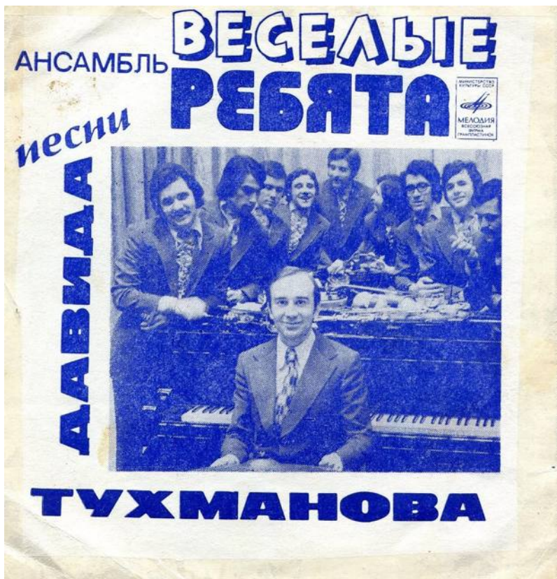
Всесоюзная Студия Грамзаписи «Мелодия», 1975 г.