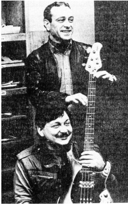
Фото из газеты «Московский комсомолец», статья «Надеемся на успех программы», январь 1986 г.

Где? Когда?» (эфир 31.11.1985 г.) с песней «Баня» (Д. Тухманов — М. Танич) (вокал — Рыжов).