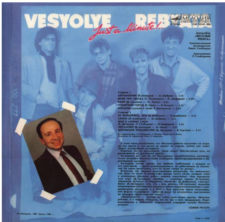
Всесоюзная фирма грамзаписи, 1987 г.

писаны с использованием электронного музыкального инструмента.