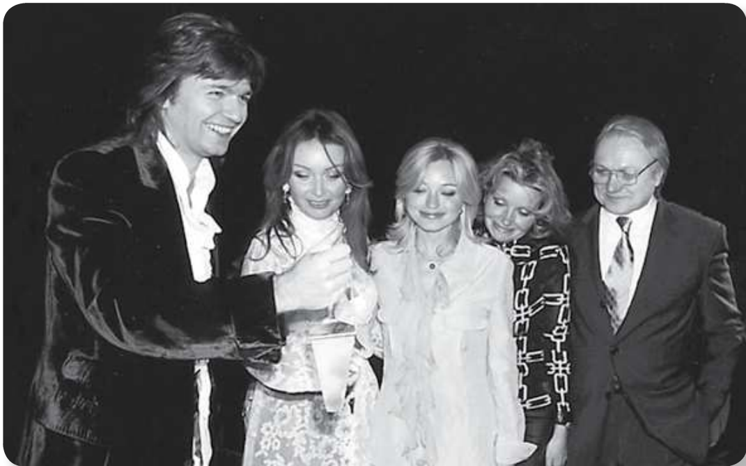
Семья на юбилее Дмитрия Маликова. 2000 год